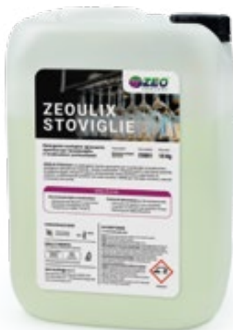
Formato: 10 Kg Confezioni: 1 tanica Art. C00001