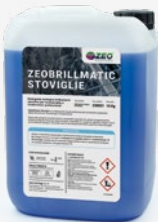
Formato: 10 Kg Confezioni: 1 tanica Art. C00021

Per la pulizia di alcune attrezzature, come i filtri delle macchine da caffè, si utilizza tal quale in una vaschetta, lasciando i pezzi in ammollo per qualche minuto quindi risciacquare abbondantemente.